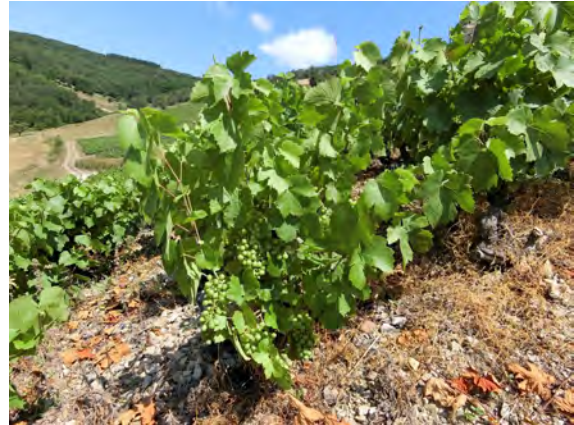
日光を取り込むために例年通り摘葉をしている

ジェットコースターのような目まぐるしい天候も落ち着き、7月後半から8月は今年のブドウにとってはまさに絶好の気象条件といえるだろう。そして「2003年を超える世紀のミレジム」がにわかに現実味を帯びてきた！次回はいよいよ収穫直前のレポートをお届けいたします！