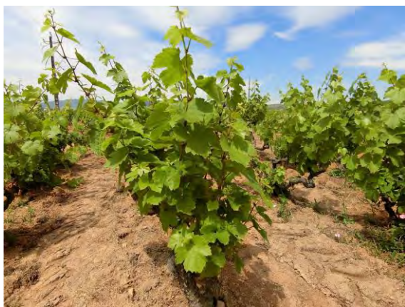
病気無く、成長を続けている

今年の開花は、昨年よりも約 1 週間遅くランシエが 5 月 31 日、ランティニエが 6 月 1 日に始まり 4 日間ほどで終わった。(サン＝テティエンヌ＝デ＝ズリエールは 5 月 26 日) 今年はランシエの畑が、標高が低く空気が停滞しやすいこともあり、5 月初めに一部霜の被害に遭った。その後すぐは気温が上がらず、ブドウの成長は前年よりも 2 週間遅れていた。6 月 7 日には瞬間風速 100m/s を超える強風が吹き荒れ、ランシエ、ランティニエの畑は一部新梢が折れる被害に遭ったが、サン＝テティエンヌ＝デ＝ズリエールの畑は誘引していたこともあって被害はほとんどなかった。春にほとんど雨が降らなかった影響で、畑は全体的に水不足だったが、6 月 13 日、14 日、15 日と計 27 mm のまとまった雨が降り、その後連日のように猛暑が続いたことで、ブドウの成長スピードに一気に勢いが増した。病気は今のところなし。収穫日は 9 月 3 日前後を予定しているが、現在も気温は 40℃ 越えの記録的な暑さが続いていて、このまま暑い夏が続くと、2003 年のようなキャラクターのワインが出来上がるかもしれない。