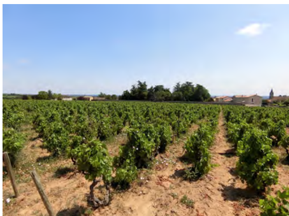
ランシエの畑は平均的な収量予測

一方ランシエのブドウは、遅霜の影響で付いている房は少ないが、それでも十分水分が足りていることもあって、どうにか平均収量を確保できそうだ。収穫日は当初予定していた通り9月3日前後を考えている。