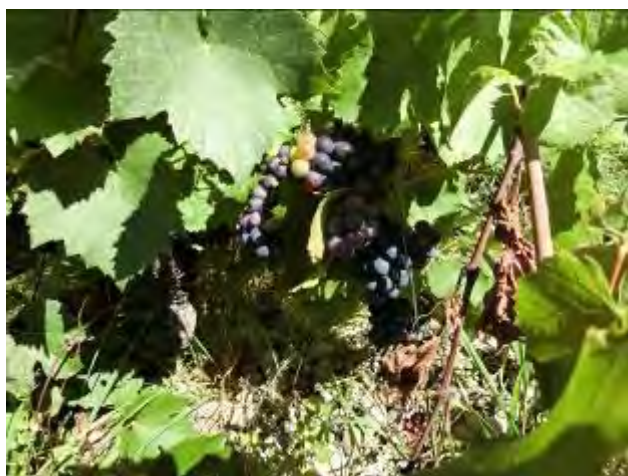
色付きがまばらなブドウ樹

ヌーヴォーの収穫は9月16日、17日で考えている。今年は6月の初めから全く雨が降らず水不足が心配されたが、8月3日、10日、18日と計60mmの雨が降り水不足の問題は完全に解消された。また、最後に降った18日の強いわか雨のおかげで、日焼けして乾いたブドウが全て落ち、今は果汁をたっぷりと含んだきれいなブドウしか残っていない！ブドウの熟しは、現在のところ春の遅霜と夏の猛暑の影響でまちまちだが、これからさらに快晴が続けば徐々に均衡が取れてくると思う。2019年ヴィンテージは、巷では2003年を超える歴史的なミレジムと騒がれているが、濃縮感の強いワインではなく、むしろ酸がチャーミングなボジョレーらしい軽快なワインに仕上げるつもりだ！