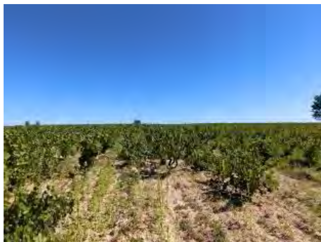
9月いっぱい快晴の予報！