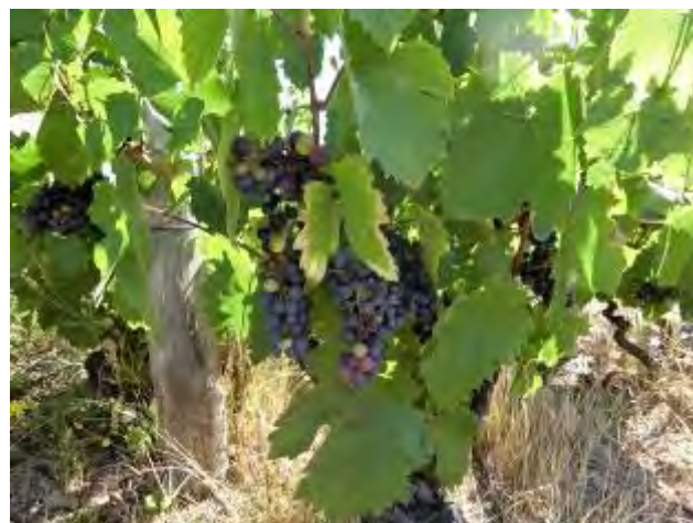
色付きがまばらなブドウ樹