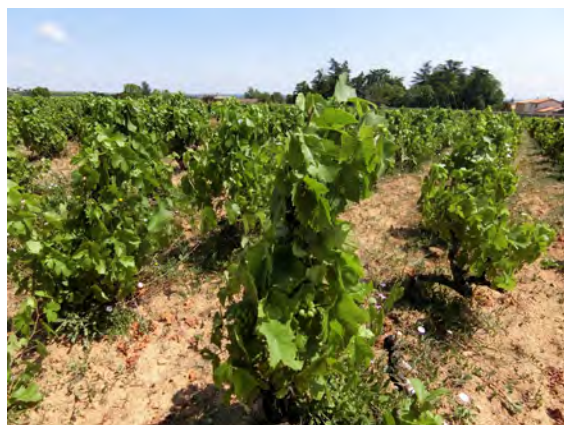
枝を紐で束ねられたゴブレ式のガメイ