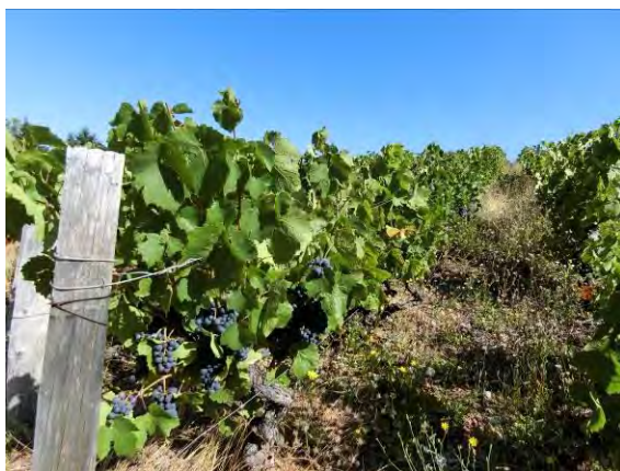
サン=テティエンヌの収穫直前のブドウ

予定通りランシエのブドウとサン=テティエンヌ=デ=ズリエールのブドウを今回はヌーヴォーに使用している。割合的には6:4でサン=テティエンヌのブドウの方が多い。サン=テティエンヌのブドウはランシエのブドウよりも酸がありライトでヌーヴォー向きだ！マセラシオン期間は8日間。今年は発酵に勢いがあり、9月20日の時点でアルコール発酵がほぼ終了したが、マロラクティック発酵がまだ始まっていない。いつもだとリンゴ酸が1L中3g~3.5g程度に収まるのだが、今年は分析の結果5.5gありマロラクティック発酵が長引きそうな予感がする。アルコール度数は12%程度。味わいた的には、当初2010年のような骨格のあるワインをイメージしていたが、8月初めの雨で果汁が十分稼げたことにより、最終的に2013年、2014年のような果実味がエレガントでみずみずしく酸の効いたチャミングなワインに仕上がろうだ！