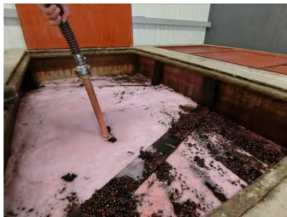
果房の上にパレット型の中蓋が敷かれている