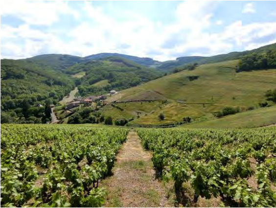
標高が高く斜度のあるマルシャン村の畑

今年のブドウ開花は、標高が最も高いマルシャン村の畑で6月15日頃始まり1週間ほどで終わった。被害はほとんどなかったが、5月初めに襲った遅霜の影響やその後の気温の涼しさもあって、開花は昨年よりも3週間遅かった。また冬と春はほとんど雨が降らず水不足が心配されたが、幸いにも6月の初めに30mmくらいのしっかりとまとまった雨が降り、さらに、6月の下旬から気温が上がり連日のように快晴が続いていることにより、ブドウは一気に成長の遅れを取り戻しつつある。ブドウの病気も、今のところ天気が乾燥していることもありほとんど見られない。ただ、このところ毎日のように気温が40度を超える記録的な猛暑に見舞われ、これがさらに続くと雹や日照り、ブドウ焼けのリスクが出てきそうなのがちょっと心配だ。今年の収穫日は今のところ昨年と同じ9月15日前後で考えている。