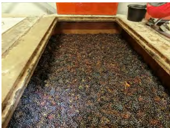
デキュヴァージュ直前の様子

ヌーヴォーの収穫は9月12日、13日に行った。今年はブドウの熟しがまちまちで、特にマルシャンの畑のブドウは成熟の早いブドウと遅いブドウが混在していた。今年は、まず初日に熟しの早いレーニエに隣接するボジョレー・ヴィラージュのブドウを収穫し、翌日マルシャンのブドウを収穫した。マルシャンのブドウは明らかに熟したブドウだけを収穫し、未熟なブドウは後日に残した。レーニエのボジョレー・ヴィラージュとマルシャンのブドウの割合は7:3くらい。いつものようにマセラシオン中は毎日タンクからジュースを抜いて、ブドウがジュースに浸らない二酸化炭素の充満だけによる完全マセラシオン・カルボニックを行っている。今のところ酢酸エチルの香りもなく発酵も順調だ。デキュヴァージュは9月19日に行っている。分析値を見る限りアルコール度数は12%~12.5%の間に収まりそうだ。2019年はレーニエのブドウのチャーミングな果実味に、マルシャンのシャープな酸とミネラルが加わった、ピュアでみずみずしくグビグビいけるワインに仕上げるつもりだ！