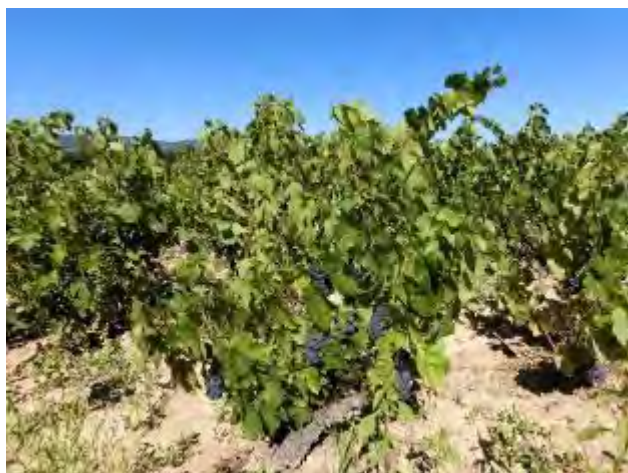
均一に熟したぶどう樹