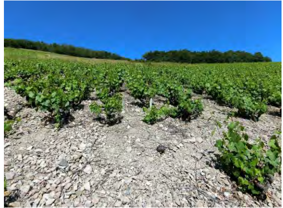
表土には花崗岩が散在しており白っぽい