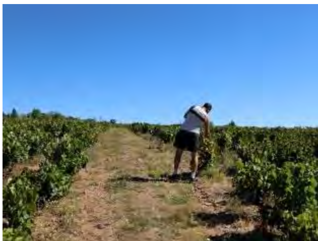
今年初仕込みのサンティエンヌ・ズリエールの畑

ヌーヴォーの収穫は当初9月3日前後を考えていたが、思っていたほどヴェレゾンが進まず結局9月7日まで収穫を引き延ばした。ちょうど天気予報では9月1日の週は全て晴マークで気温も上昇するとの予報があり、さらに8月終わりに降ったまとまった雨がブドウの最後の成熟を加速してくれるはずなので、7日が収穫のタイミングとしてはベストだろう。今年は春の遅霜や夏の猛暑の影響によりブドウの熟しがまちまちなため、収穫時には健全なブドウと一緒に一部ロゼ色の未熟なブドウも混じるかと思うが、最近では気候変動による温暖化の影響なのか、多くのヴィニヨロンがむしろ酸を補うロゼ色の未熟なブドウを重宝する傾向にある。いずれにせよ今年はボジョレーの当たり年であることは間違いない！夏焼けした一部のブドウ以外は状態が完ぺきで果汁も十分にあり、さらに酸もしっかり確保できている。バランスの優れていた2010年を彷彿させるようなワインになるような予感がする。