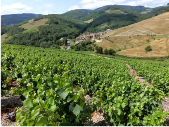
マルシャン村の収穫は9月15日前後の予測

現在ブドウは病気も一切なく健全な状態を保っている。6月の初めから全く雨が降らず心配された水不足の問題も、8月初めにしっかりと雨が降ってくれたおかげで解消された。今年の収穫日は前回の予想と変わらず9月15日前後で考えている。このまま何も問題なく収穫までたどり着けたら、ニュースで言うような世紀のミレジムになるかもしれない！