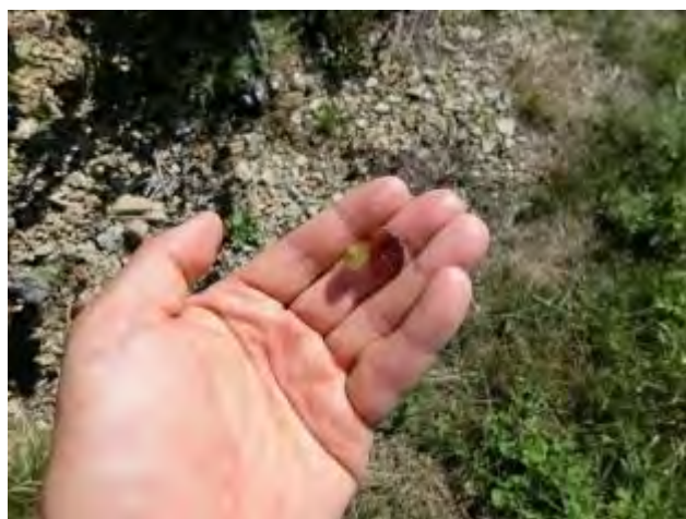
粒の成熟も最終段階！

カリーム、ジャン、ケヴィン&フレッド共に今年のワインの方向性が固まってきたようだ！