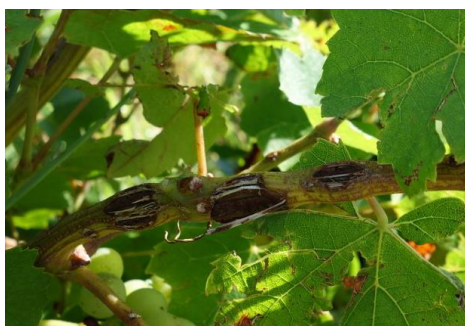
写真① 雹のダメージを受けた枝

これは去年2016年の雹にやられたランシエのブドウの木の写真だ。(写真①) 枝のえぐられ方を見ると、雹の被害の結果がどれだけ惨憺たるものだったかが良くわかる。これだけのインパクトがあると、さすがにブドウの樹液は循環が悪くなり成熟にブレーキがかかる。一方で、雹に当たらなかったブドウは通常通り成熟し、これが一つの木でブドウの成熟が各自バラバラという現象を生む。カリーム曰く、2016年は幸い夏が猛暑で、結果的にブドウの超熟と未熟が同時進行し、このまばらな熟し度合いがワインに最高のバランスをもたらしたが、これがもし冷夏だった