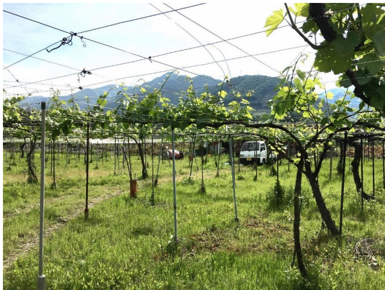
2018/5/12 勝沼町上岩崎狐原 甲州

収穫が8月後半になったデラウェアは果実がしぼみ、剪定を強くしたことも受けて減収となった。巨峰は糖度が24を超えた畑もあり、総じて出来は良かったのだが、畑を一部返却した分は減収。甲州は昨年より増収であったが、9月の多雨により糖の上昇は鈍く病気は出なかったものの、期待したほどの熟度は得られなかった。ヴィニフェラは9月の多雨で割れが生じ、シャルドネはほぼ壊滅。プチマンサンは熟度の伸びが遅く、収穫時期も含めてまだまだ改善が必要と感じた。