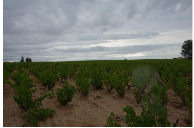
雨が降りそうな気配はあるが・・・