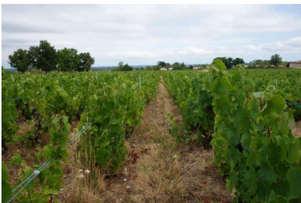
雑草効果に期待したのだが・・・

だが、経験上猛暑の年は注意しなければならないことがあり、それは猛暑の時のブドウは発酵が往々にして進まないことだ。見た目がきれいで完璧なブドウでも、自然酵母が少ないためか、発酵が途中でブロックしてしまうことが良くある。今年は予めその辺りも念頭に入れて醸造には細心の注意を払うつもりだ！