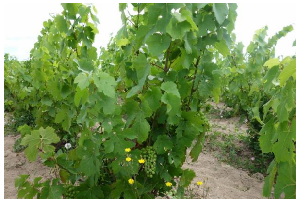
ブドウは何の問題もなく順調に生育している！