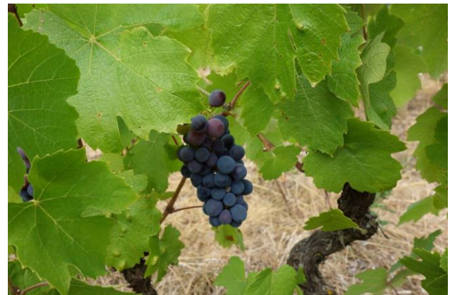
満遍なく色づいているブドウ

2015年ミレジムを決めるこれからのキーポイントは「雨」！収量、品質共に8月の天候が大きく左右しそうだ！次回はいよいよ収穫レポート！果たしてどのような結末が待っているのか、乞うご期待！