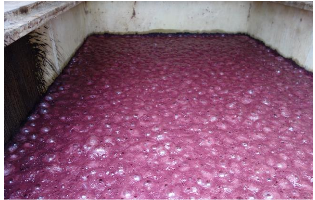
プレスが終わりタンクへと戻されたマス