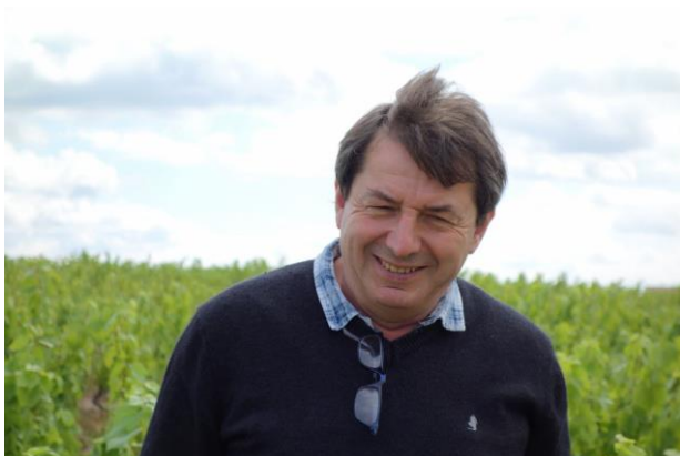
順調な気候で笑顔がこぼれるジャン！

ここまでは大体2014年とペースがほとんど同じ。ただ、去年は7月中旬から天候が一気に崩れてしまったので、今の時点でビックヴィンテージと断定するのは難しいが、もしこのまま天候が崩れず乾燥した天候が続けば2009年のような当たり年、さらに猛暑が加われば、2003年のようなヌーヴォーの当たり年となり得るだろう！