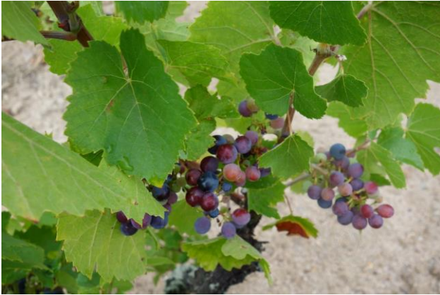
ブドウは小粒で綺麗な状態

引く水不足と猛暑の影響で、ヴェレゾンの時期から成長にブレーキがかかっている。しかし今年は幸いにもブドウの果皮が厚く、ほとんど傷んでいないので、とにかくこれから雨がしっかりと降り、ブドウの成長サイクルが正常に戻ることを祈っている。