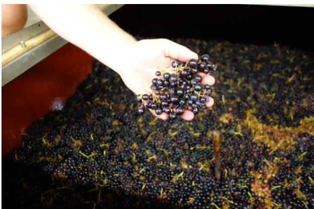
マセラシオン中のガメイ

余談だが、先週ケヴィンと一緒に我々の2014年ヌーヴォーを久しぶり試飲した。驚いたのは、去年よりも味わいがエレガントで、バラや柑橘系の香りが全開で、一瞬ブラインドで飲むとタベルのラングロールと勘違いしてしまいそうなくらい官能的なワインに変化していた！これでお分かりのように、ヌーヴォーは期間限定のお祭りではあるが、しっかりとつくったワインは、通常のワインと同じく毎年味わいが進化し、美味しくなっていくということだ！さらに今年のワインは2014年を上回る美味しさを秘めていると断言できる！解禁のタイミングで飲みつつ、その後のとっておきワインとして、熟成を楽しんで欲しい！