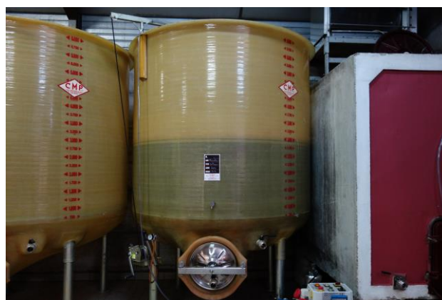
プレス後、タンクへと移された発酵中のマスト