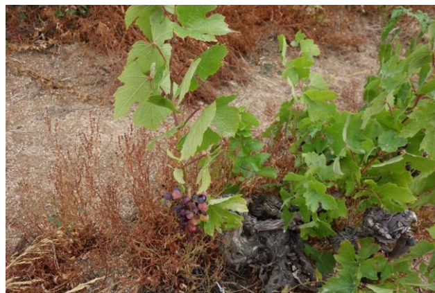
猛暑で雑草が枯れている