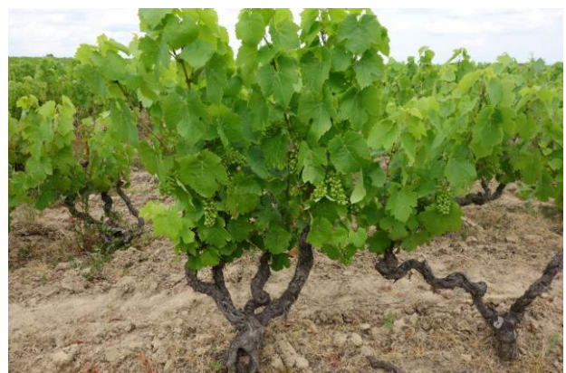
地面は非常に乾燥している